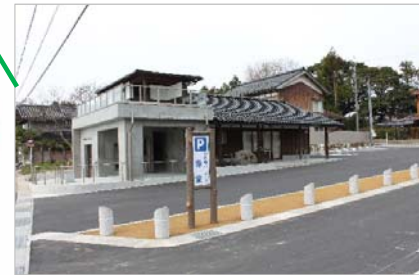
寄り道パーキング 雲津