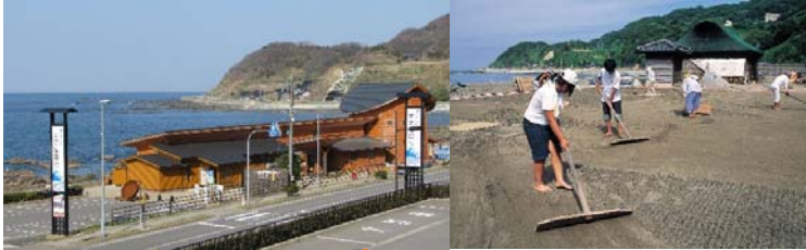
道の駅 すす塩田村