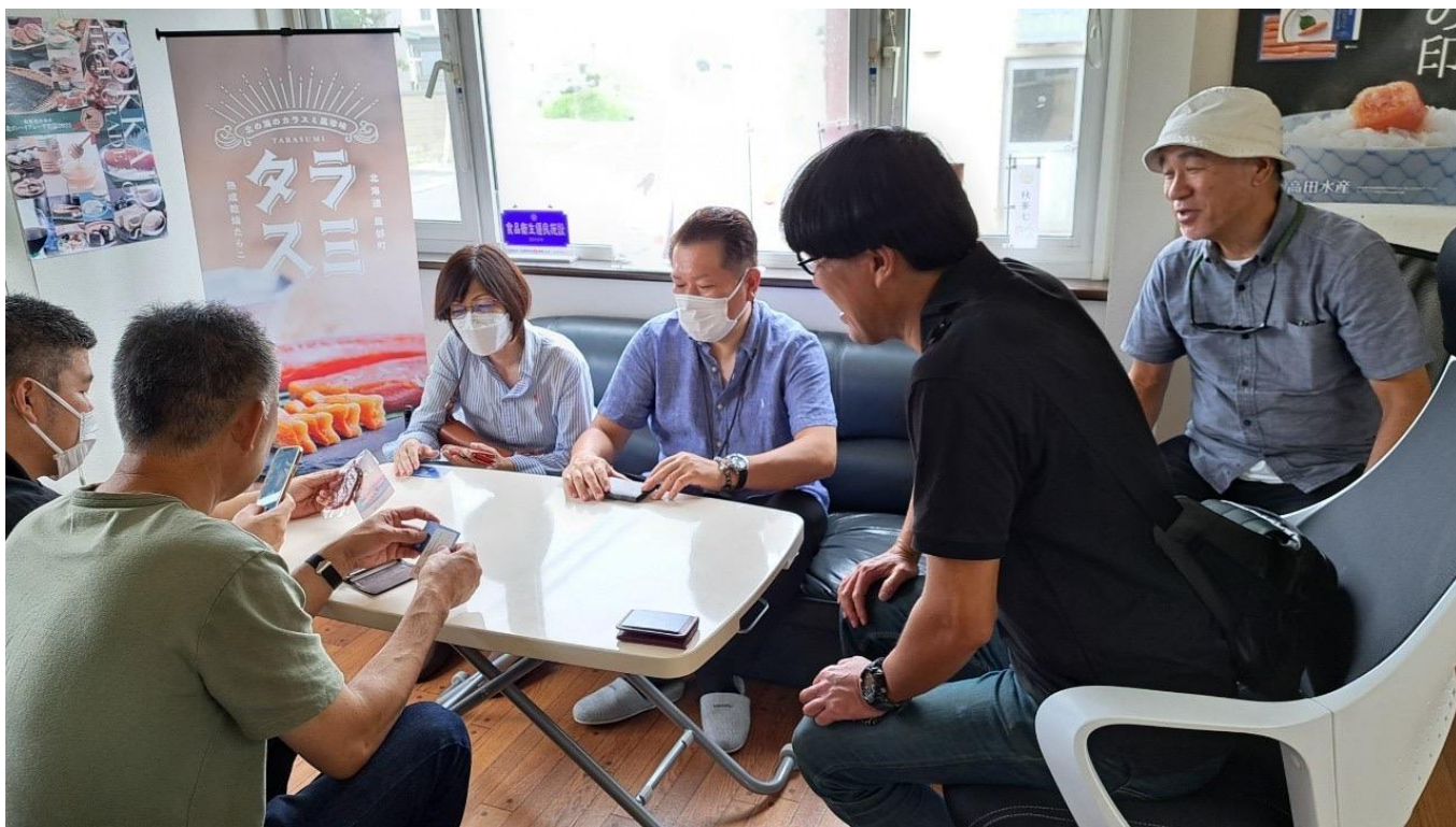
北海道「道の駅」や水産加工企業との意見交換