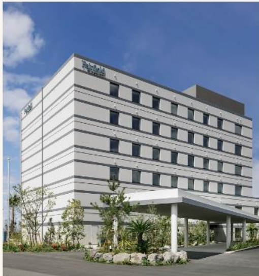
フェアフィールド・バイ・マリオット・鹿児島 島たるみず桜島 鹿児島