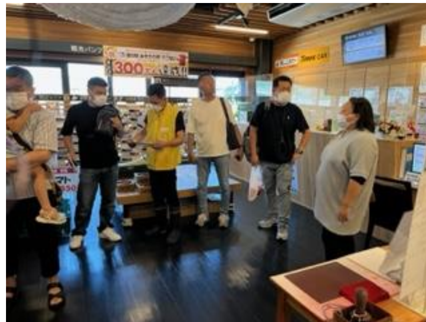
「道の駅きこない」海産物に興味津々の駅長たち