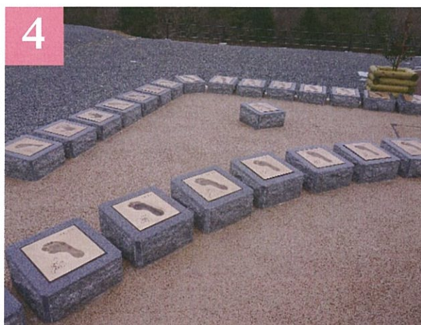
子供たちのアイデアが実現した「ならばPA」

◇交流会 場所/ワンダーファーム 時間/18:00~20:00 いわき市四倉町中島三反田地内 TEL.0246(85)5105 参加費 /5,000 円