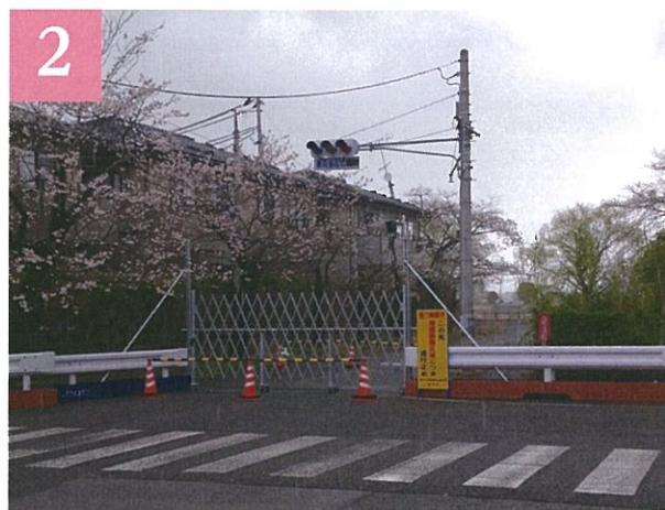
バリケードで分断される夜ノ森の桜並木