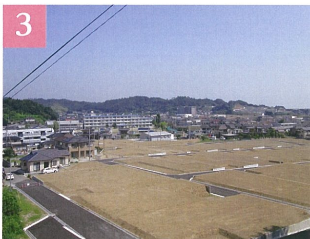
津波被災地の復興区画整理事業