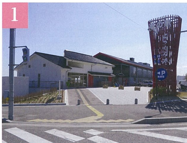
いち早く復興した道の駅よつくら港

いわき市(道の駅よつくら港・久ノ浜防災緑地)→ 楢葉町(道の駅ならば・ならばPA)→富岡町(夜ノ森)