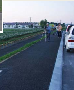
ビューポイントパーキング メルヘンの丘（R39 大空町）