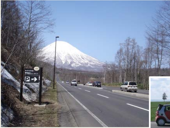
ビューポイントパーキング 羊蹄山（R276 喜茂別町）