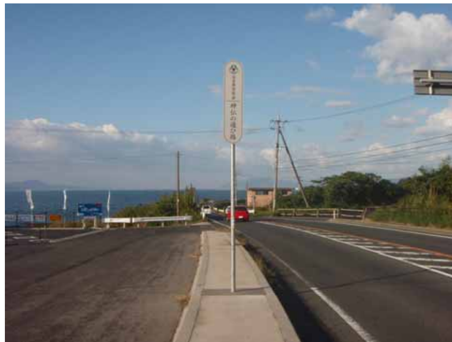
ルートサイン(道の駅用)