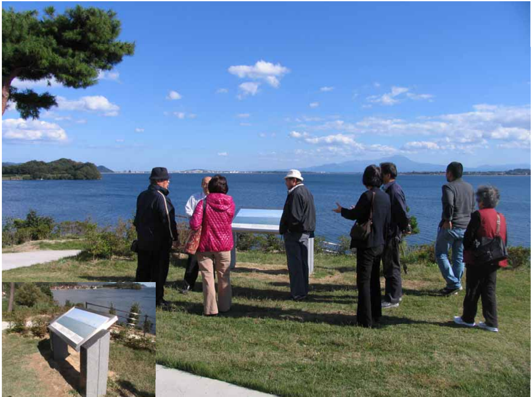
道の駅「本庄」 ビュースポット風景案内板～中海、大根島、大山を眺望